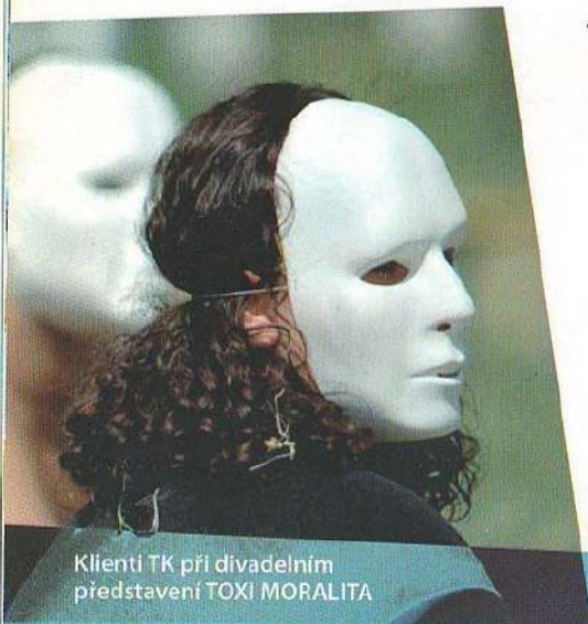
Klienti TK při divadelním představení TOXI MORALITA

abstinance, absolvovali jste nějaký léčebný program a potřebujete ještě následnou podporu v životě bez drog, je pro vás patrně vhodné obrátit se na Jamtana na Francouzské ulici v Brně. Je sem možné individuálně docházet, ale i využít nabídku chráněného bydlení (je-li vám více než 18 let). Jamtana nabízí skupinovou i individuální psychoterapii, sociální pomoc a podporu. Kontaktovat nás opět mohou i rodinní příslušníci a přátelé klientů. Můžete využít chráněnou dílnu Eikón v Brně, která se zaměřuje na práci se dřevem. Tady je možné si přivydělat – i aktivně strávit čas a mít podporu při shánění jiné práce.